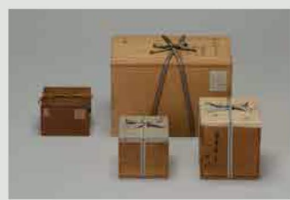
「黒樂四方茶碗 銘 山里」の箱一式

たくさん作品を保管する収蔵庫の扉を開けると、棚に並んでいるのは箱、箱、箱...。ふだんは表舞台に出ることの少ない「作品を収納するための箱」を、作品と共に特別公開。