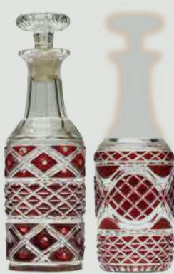
右 薩摩切子 紅色被筆筒 一口 左 薩摩切子 紅色被檢付瓶 一口 共に江戸時代 19世紀

いまの姿が制作当初の姿とは限らない?「切断」の可能性が高い作品を、再現展示を一部取り入れてご紹介。