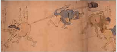
放屁合戦絵巻(部分) 一卷 室町時代 文安6年(1449)写

これも本当に美術なの?思わず「心がざわつく」ような作品の数々を手掛かりに、単に「美しい」の一言ではなくることのできる、日本美術の懐の深さをご案内。